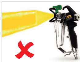
При появлении полос, плавно увеличивайте давление