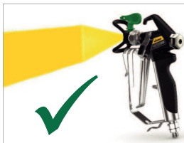
Идеальный факел распыления без полос